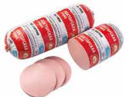
ДОКТОРСКАЯ ГРАНД В/С