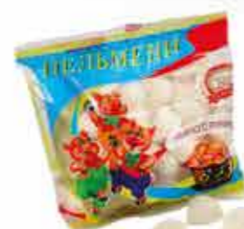
ПЕЛЬМЕНИ «ОШМЯНСКИЕ ФИРМЕННЫЕ»