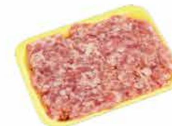
ФАРШ МЯСНОЙ СОЛЕНый «СВИНОЙ НОВЫЙ»