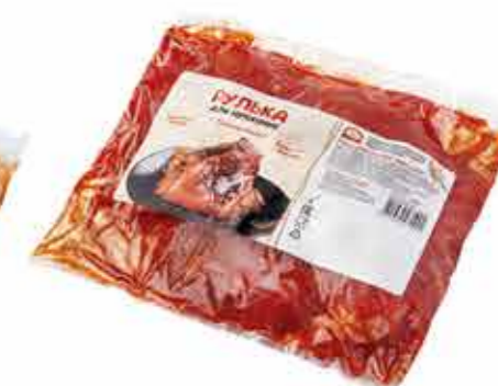
РУЛЬКА ДЛЯ ЗАПЕКАНИЯ «АППЕТИТНАЯ»