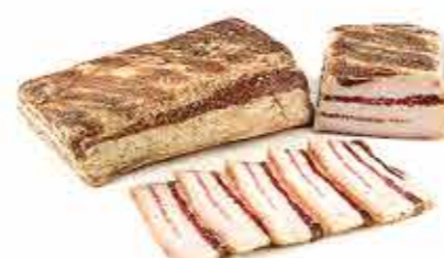
ГРУДИНКА КРЕСТЬЯНСКАЯ СОЛЕНАЯ