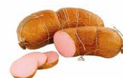
ДОКТОРСКАЯ КЛАССИЧЕСКАЯ ГРАНД В/С