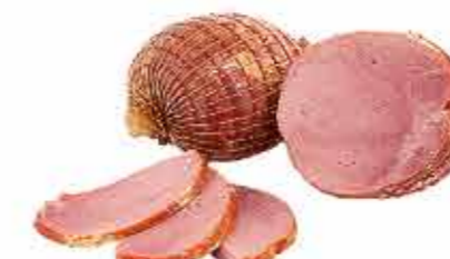
ОРЕХ ДВОРЯНСКИЙ ГУРМАН