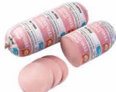
МОЛОЧНАЯ НЕЖНАЯ В/С