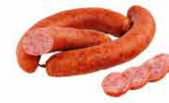
КОЛБАСА П/К ЯРМАРОЧНАЯ ОРИГИНАЛЬНАЯ 2/С