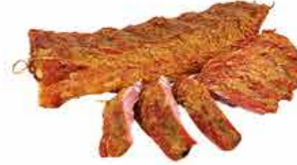
РЕБРА АРОМАТНЫЕ ГУРМАН