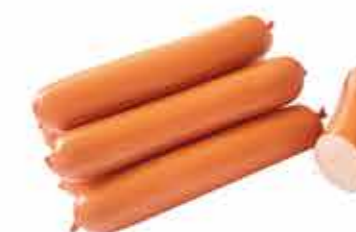
СОСИСКИ СЕМЕЙНЫЕ 1/С