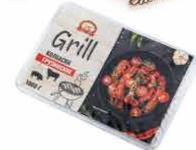
КОЛБАСКИ ГРУЗИНСКИЕ В МАРИНАДЕ