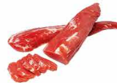
ПРОДУКТ С/В ВЫРЕЗКА ПРАЗДНИЧНАЯ