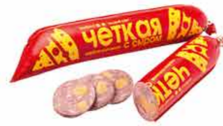
КОЛБАСА В/К ЧЁТКАЯ С СЫРОМ В/С