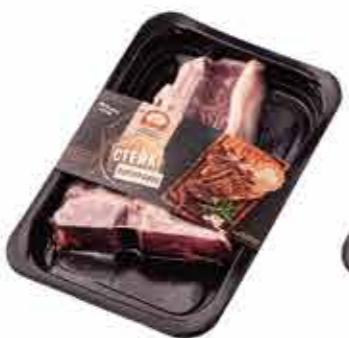
ПОЛУФАБРИКАТ ИЗ ГОВЯДИНЫ «СТЕЙК ПОРТЕРХАУС»