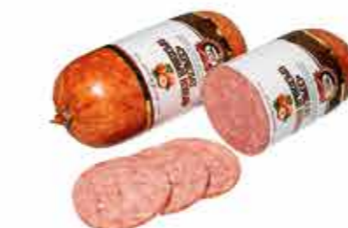
СЕРВЕЛАТ В/К ОРЕХОВЫЙ НОВЫЙ В/С