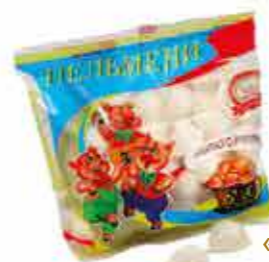
ПЕЛЬМЕНИ «ОШМЯНСКИЕ ОБЫЧНЫЕ»