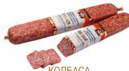
КОЛБАСА С/В МИЛАНСКАЯ В/С