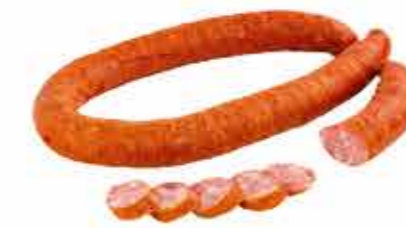
КОЛБАСА П/К ОШМЯНСКАЯ ОРИГИНАЛЬНАЯ 1/С