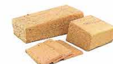
ПАШТЕТ ОШМЯНСКИЙ ЗАПЕЧЕННЫЙ