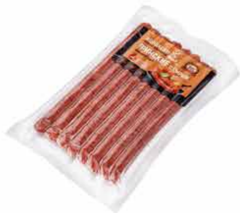
КОЛБАСКИ В/К ФИНСКИЕ С СЫРОМ В/С