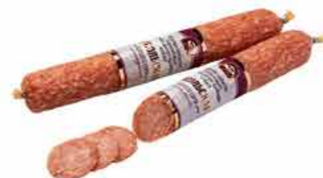
САЛЯМИ С/К ПОСОЛЬСКАЯ В/С