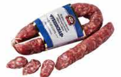
САЛЯМИ С/К РУБЛЕВСКАЯ В/С