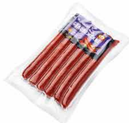
КОЛБАСКИ П/К БЕЛОВЕЖСКИЕ В/С