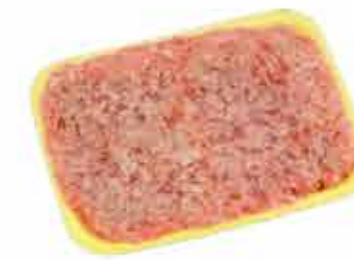
ФАРШ МЯСНОЙ СОЛЕНый «ДОМАШНИЙ»