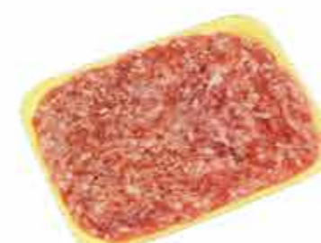
ФАРШ МЯСНОЙ СОЛЕНый «КРЕСТЬЯНСКИЙ НОВЫЙ»