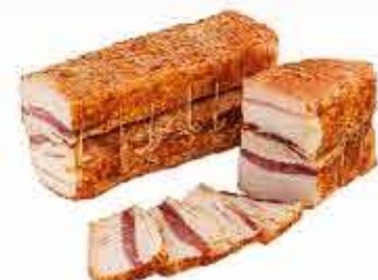
ГРУДИНКА ВЕНГЕРСКАЯ СОЛЕНАЯ