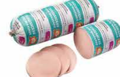
ГОЛЬШАНСКАЯ ОРИГИНАЛЬНАЯ 2/С