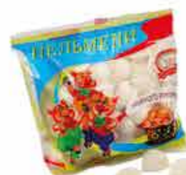
ПЕЛЬМЕНИ «ОШМЯНСКИЕ БЛАГОДАТНЫЕ»