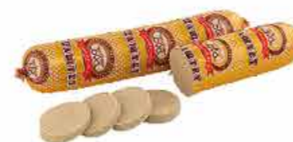
ПАШТЕТ ПЕЧЕНОЧНЫЙ С ЛУКОМ