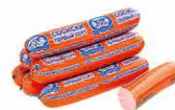
СОСИСКИ ГОРОДЕЙСКИЕ НЕЖНЫЕ 1/С