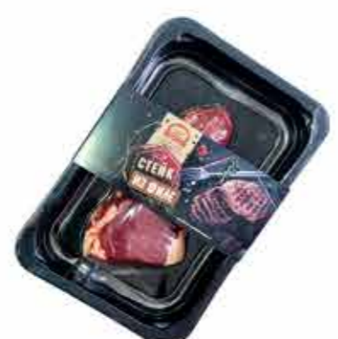
П/Ф ИЗ ГОВЯДИНЫ «СТЕЙК ИЗ ФИЛЕ»