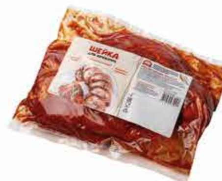
ШЕЙКА ДЛЯ ЗАПЕКАНИЯ «АППЕТИТНАЯ»