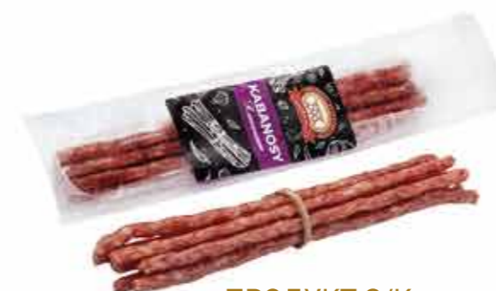
ПРОДУКТ С/К КАБАНОСЫ «КЛАССИЧЕСКИЕ» 85 г