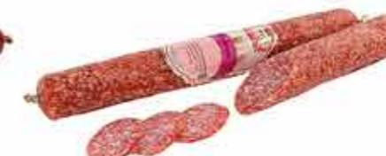
КОЛБАСА С/В ПАНСКАЯ В/С