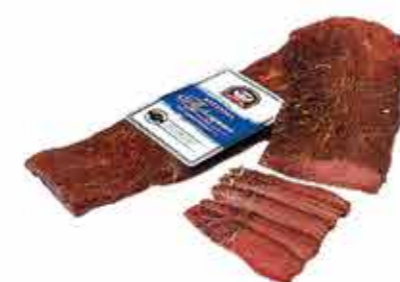
ПРОДУКТ С/К БАСТУРМА ТУРЕЦКАЯ