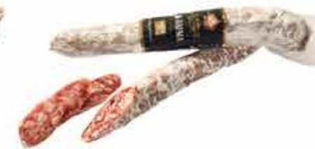
САЛЯМИ С/В ЛА-ПАРМА В/С