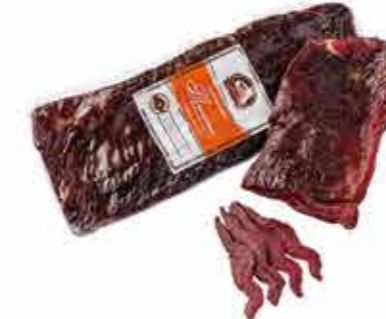
ПРОДУКТ С/В ТОСКАНО