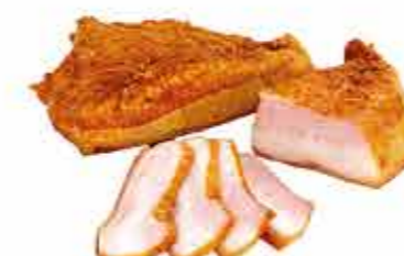
ЩЕКОВИНА АППЕТИТНАЯ ГУРМАН