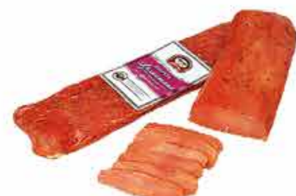
ПРОДУКТ С/К ПОЛОСКА АРОМАТНАЯ