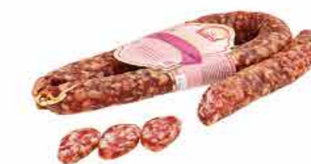
КОЛБАСА С/В ЗАКУСКА ИЗ ДЕРЕВНИ ПРЕМИУМ В/С