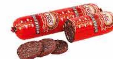
КОЛБАСА КРОВЯНАЯ ПО-ДОМАШНЕМУ