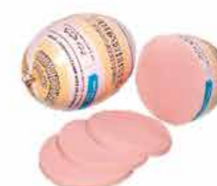
ОШМЯНСКАЯ С МАСЛИЦЕМ КЛАССИЧЕСКАЯ В/С