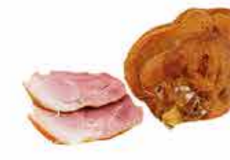
ГОЛЯШКА ЕВРОПЕЙСКАЯ ГУРМАН