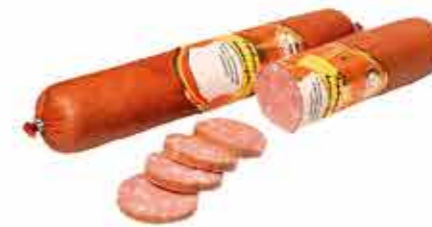
КОЛБАСА В/К ДЕРЕВЕНСКАЯ В/С