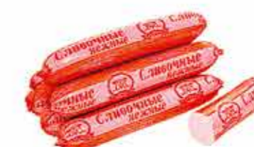
СОСИСКИ СЛИВОЧНЫЕ ЛЮКС В/С