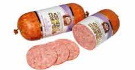
САЛЯМИ В/К СЕРВЕЛАТ СТОЛИЧНЫЙ В/С