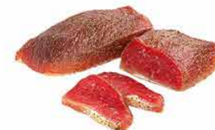
ПРОДУКТ С/К КУМПЯЧОК ДОМАШНИЙ