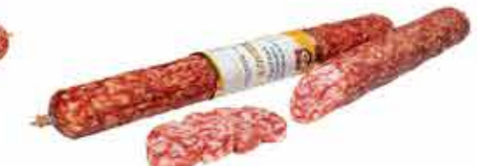
САЛЯМИ С/В МЕДОВАЯ ПРЕМИУМ В/С