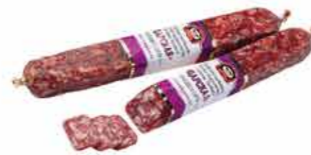
САЛЯМИ С/К ЦАРСКАЯ В/С