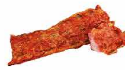
ЗАКУСКА ПРЯНАЯ ГУРМАН