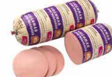
ЛЮБИМАЯ ОРИГИНАЛЬНАЯ В/С