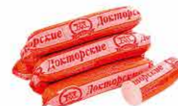
СОСИСКИ ДОКТОРСКИЕ ЛЮКС В/С