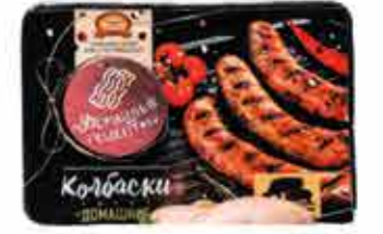
КОЛБАСКИ СЫРЫЕ «ДОМАШНИЕ»