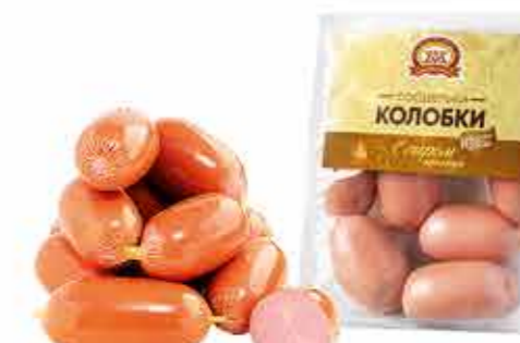
САРДЕЛЬКИ КОЛОБКИ С СЫРОМ ПРЕМИУМ В/С