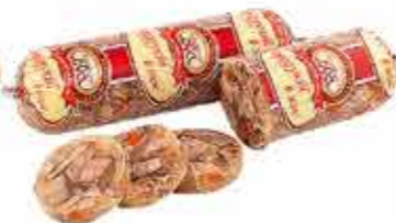
ХОЛОДЕЦ ЯЗЫК СВИНОЙ В ЖЕЛЕ