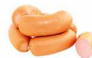
САРДЕЛЬКИ ДОКТОРСКИЕ ЛЮКС В/С