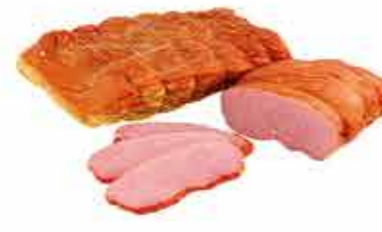
БУЖЕНИНА ПО-ОШМЯНСКИ ГУРМАН