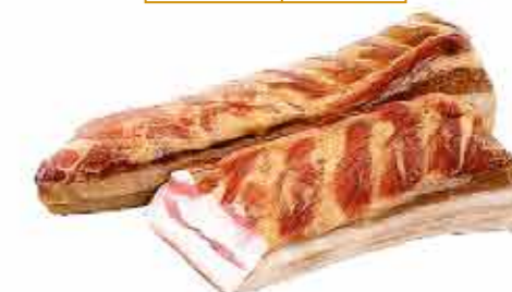
ПРОДУКТ С/К ГРУДИНКА ПРАЗДНИЧНАЯ