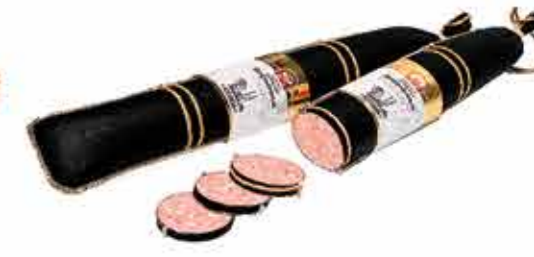
СЕРВЕЛАТ В/К ФИРМЕННЫЙ В/С