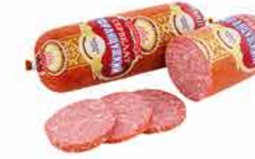
СЕРВЕЛАТ В/К ФРАНЦУЗСКИЙ В/С