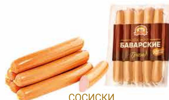
СОСИСКИ БАВАРСКИЕ ГРАНД В/С