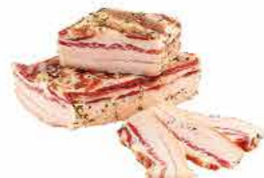
ГРУДИНКА ДЕРЕВЕНСКАЯ СОЛЕНАЯ