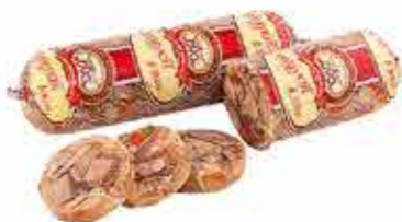
ХОЛОДЕЦ ЯЗЫК ГОВЯЖИЙ В ЖЕЛЕ