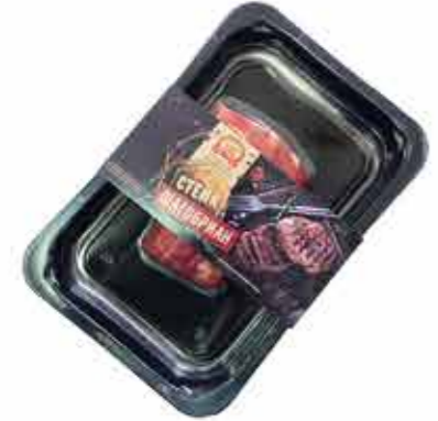
П/Ф ИЗ ГОВЯДИНЫ «СТЕЙК ШАТОБРИАН»