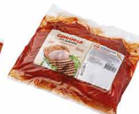
СВИНИНА ДЛЯ ЗАПЕКАНИЯ «АППЕТИТНАЯ»