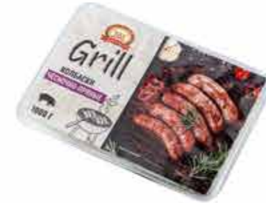
КОЛБАСКИ ЧЕСНОЧНО-ПРЯНЫЕ В МАРИНАДЕ