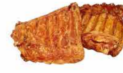
РЕБРА СТОЛИЧНЫЕ ГУРМАН