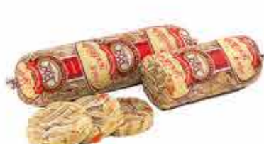
ХОЛОДЕЦ ФЛЯЧКИ В ЖЕЛЕ