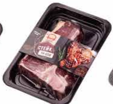
ПОЛУФАБРИКАТ ИЗ ГОВЯДИНЫ «СТЕЙК ТИ-БОН»