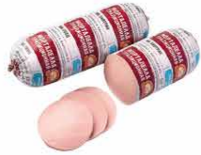
МОРТАДЕЛЛА ТРАДИЦИОННАЯ В/С