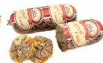
ХОЛОДЕЦ СЕРДЦЕ ГОВЯЖЬЕ В ЖЕЛЕ