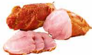
ВЕТЧИНА ДВОРЯНСКАЯ ГУРМАН