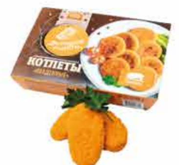
КОТЛЕТЫ «ОБЕДЕННЫЕ» 0.4