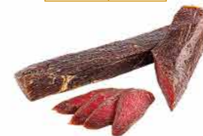
ПРОДУКТ С/К ГОВЯДИНА ПРАЗДНИЧНАЯ