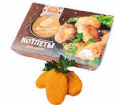
КОТЛЕТЫ «ДОМАШНИЕ» 0.4