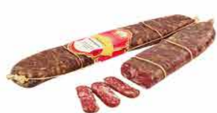
ПРОДУКТ С/К БАБУШКИН ПАЧАСТУНАК