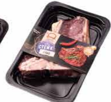
ПОЛУФАБРИКАТ ИЗ ГОВЯДИНЫ «СТЕЙК КЛУБ»