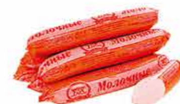
СОСИСКИ МОЛОЧНЫЕ НЕЖНЫЕ В/С