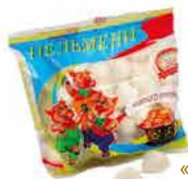
ПЕЛЬМЕНИ «ОШМЯНСКИЕ НЕЖНЫЕ»