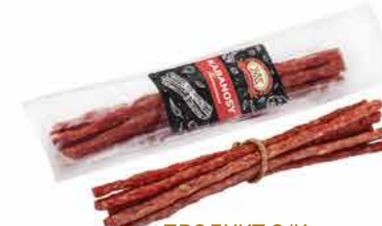
ПРОДУКТ С/К КАБАНОСЫ «ПИКАНТНЫЕ» 85 г