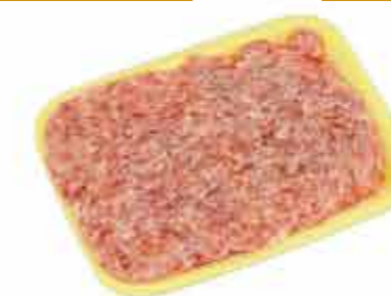
ФАРШ МЯСНОЙ СОЛЕНый «КОТЛЕТНЫЙ ОСОБЫЙ»