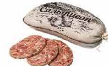
САЛЬТИСОН С ХРЕНОМ