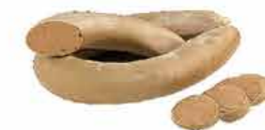
КОЛБАСА ЛИВЕРНАЯ СЫТНАЯ