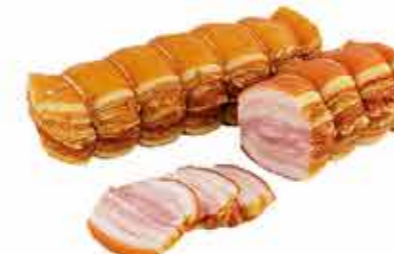
ГРУДИНКА ДВОРЯНСКАЯ ГУРМАН