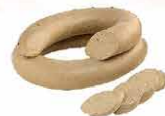
КОЛБАСА ЛИВЕРНАЯ СЕЛЬСКАЯ