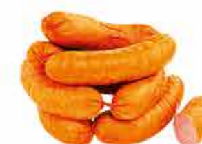
ШПИКАЧКИ МИНСКИЕ 1/С