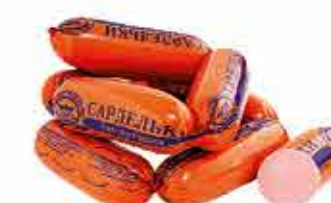
САРДЕЛЬКИ ГОРОДЕЙСКИЕ 1/С