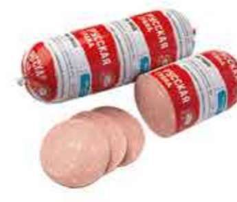
РУССКАЯ ГРАНД В/С