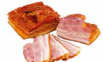
ПАШИНА БЕЛОВЕЖСКАЯ ГУРМАН