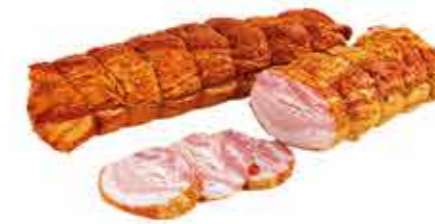
БЕКОН ОШМЯНСКИЙ ГУРМАН