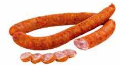
КОЛБАСА П/К СВОЙСКАЯ ОРИГИНАЛЬНАЯ 1/С