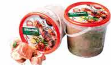
ШАШЛЫК «ОШМЯНСКИЙ ОРИГИНАЛЬНЫЙ»