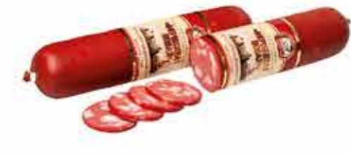
КОЛБАСА В/К ФИРМЕННАЯ НОВАЯ В/С