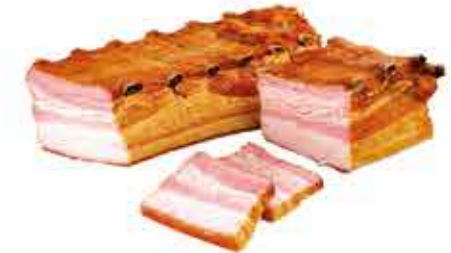
БОЧОК ФИРМЕННЫЙ ГУРМАН