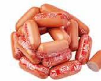
СОСИСКИ МИНИ В/С