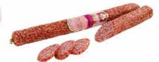
КОЛБАСА С/В РИЖСКАЯ В/С