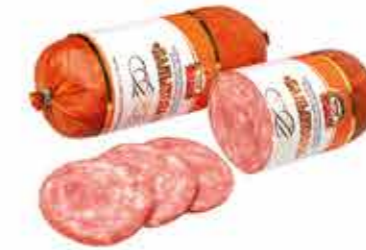
КОЛБАСА В/К БАЛЫКОВАЯ В/С