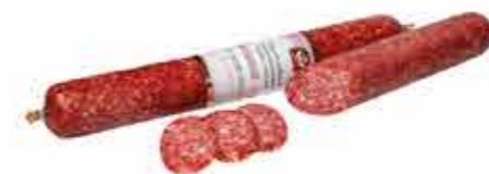
КОЛБАСА С/В БРАУНШВЕЙГСКАЯ В/С