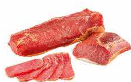
ПРОДУКТ С/К ПОЛОНДВИЦА ДОМАШНЯЯ