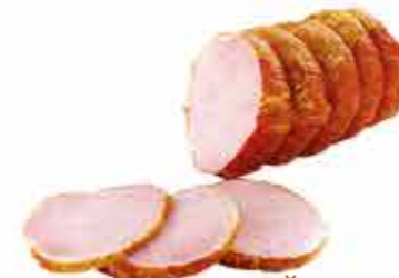
ФИЛЕЙ ЭЛИТНЫЙ ГУРМАН