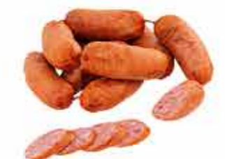
КОЛБАСКИ П/К ДЛЯ БАРБЕКЮ 1/С