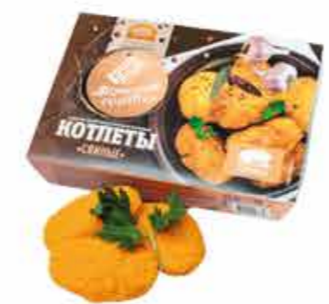
КОТЛЕТЫ «СВИНЫЕ» 0.4