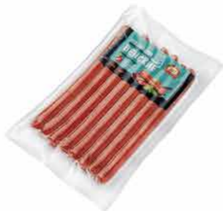
КОЛБАСКИ В/К ВЕНСКИЕ В/С