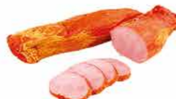
ВЫРЕЗКА АППЕТИТНАЯ ГУРМАН