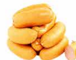
САРДЕЛЬКИ СОЧНЫЕ В/С