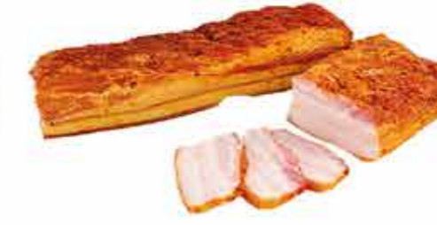
ГРУДИНКА АППЕТИТНАЯ ГУРМАН