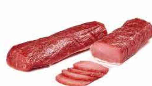
ПРОДУКТ С/В ПОЛОНДВИЦА ПО ДЕРЕВЕНСКИ