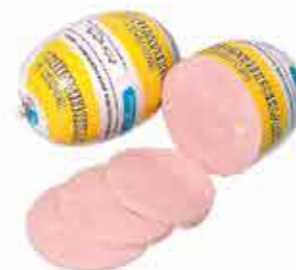
ОШМЯНСКАЯ С СЫРОМ КЛАССИЧЕСКАЯ В/С