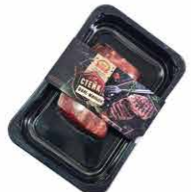
П/Ф ИЗ ГОВЯДИНЫ «ФИЛЕ МИНЬОН»