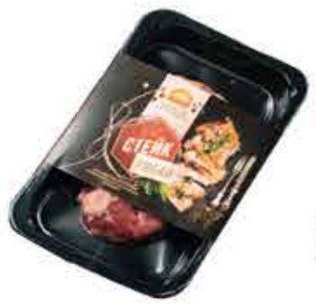
ПОЛУФАБРИКАТ ИЗ ГОВЯДИНЫ «СТЕЙК РИБАЙ»