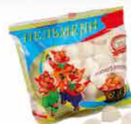
ПЕЛЬМЕНИ «ОШМЯНСКИЕ СЕВЕРНЫЕ»