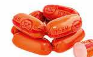
САРДЕЛЬКИ ЛЮБИМЫЕ ОРИГИНАЛЬНЫЕ В/С