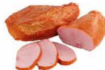
КУМПЯЧОК ЕВРОПЕЙСКИЙ ГУРМАН