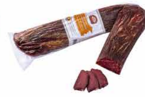
ПРОДУКТ С/В САНТОРИНИ