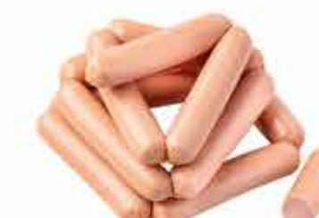
СОСИСКИ СВИНЫЕ В/С