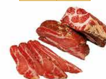
ПРОДУКТ С/К СВИРИНА ПРАЗДНИЧНАЯ