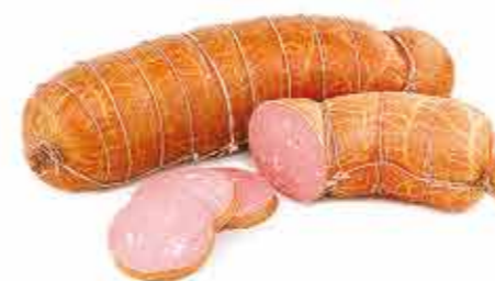
СМАЧНАЯ ПО-ОШМЯНСКИ В/С