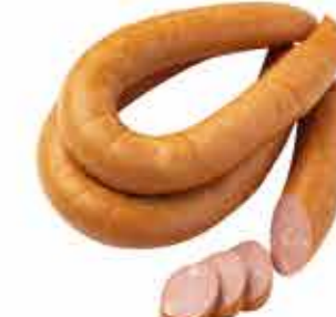
ХУТОРСКАЯ С САЛЬЦЕМ 1/С