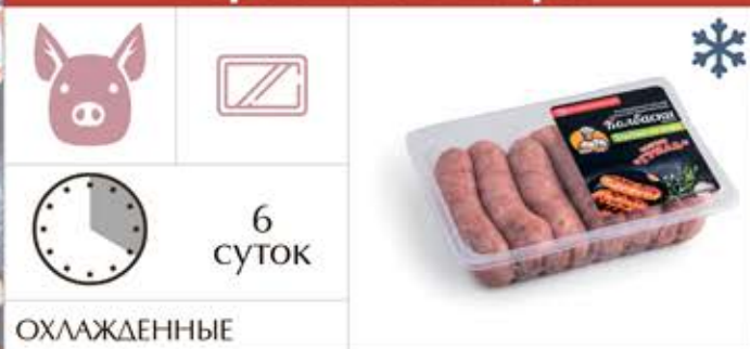
Колбаски сырые «Барбекю от шефа»