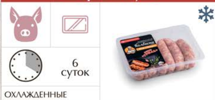
Колбаски сырые «Шеф советует»