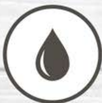
Жир пищевой говяжий, свиной