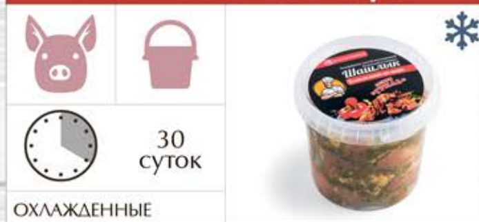
Шашлык «Комплимент от шефа»